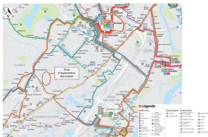
Plan du réseau de transports en commun à proximité du projet.

Le volet I de l'évaluation environnementale analyse l'état actuel des mobilités dans cette zone de la métropole toulousaine .