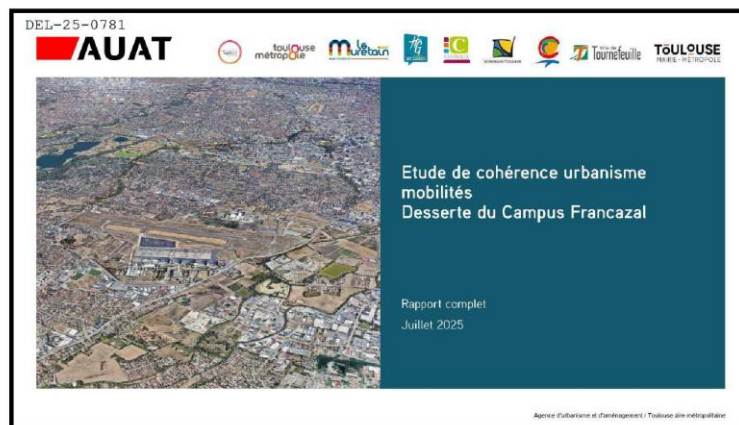
Étude de l'AUAT de juillet 2025 qui aurait dû faire partie du dossier d'enquête publique

Cette étude (cf. lien ci-dessus pp. 42, 46, 64) utilise explicitement les "perspectives d'emplois" de Francazal pour justifier des "aménagements plus lourds" (projets routiers PIMSOT/BUCSM) et une configuration poids-lourds de l'avenue Barès. Nous refusons que ce projet industriel devienne un levier de justification d'infrastructures routières structurantes dont la pertinence est discutée.